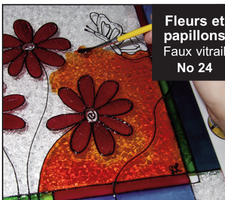
Flours et papillons Faux vitrail No 24

Je n'ai pas suffisamment testé ce produit pour en connaître tout son potentiel mais à première vue, j'ai remarqué qu'il est difficile de faire des