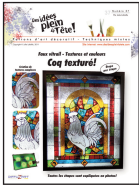
Patron no 37 - Coq Texturé